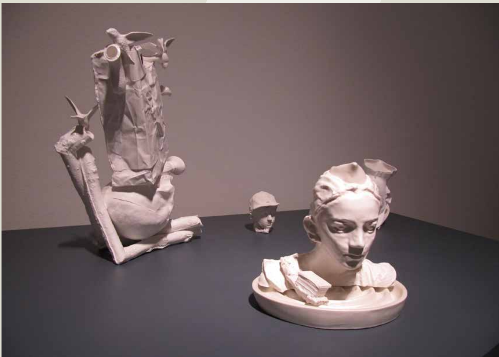
圖 1 作者：Roderick Bamford。作品名稱：The Sequestator: To-be (Jug)，創作年代：2011。材質：瓷土，尺寸：28 x 20 x 20 cm。