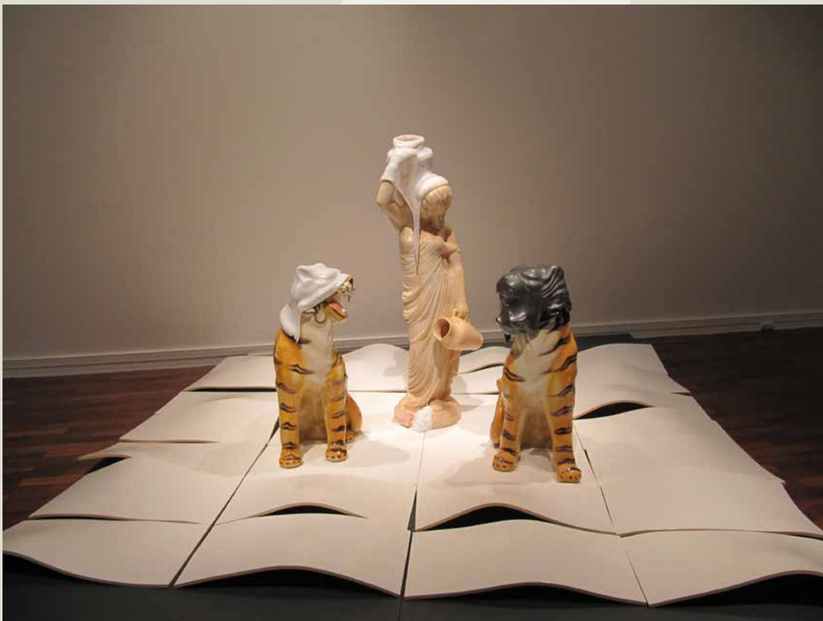
圖4 作者：Paul Wood。作品名稱：Guardians of a Goddess，創作年代：2011。成型方式：將玻璃現成物熔於陶瓷現成物上。